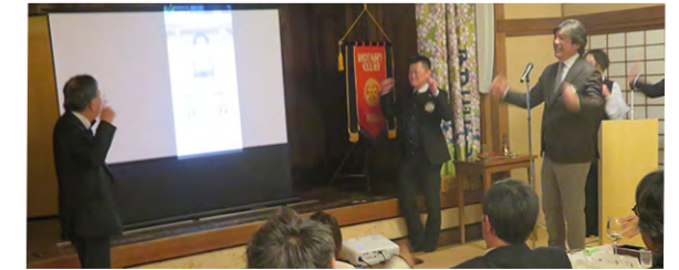
各テーブル代表者(回答者)