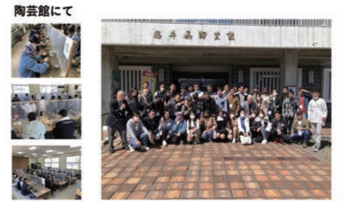
2023年3月23日(福井新聞)掲載記事

11時30分に伊呂波にて昼食を兼ね「和食マナー教室」その後、お抹茶作法を遠州流越前武生支部の皆様ご協力のもと、体験をしていただきました。