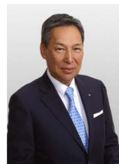
馬場 益弘ガバナー