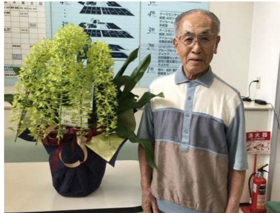
6月21日にお届けいたしました