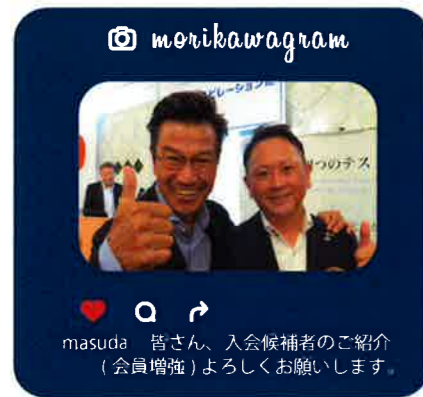
masuda 皆さん、入会候補者のご紹介(会員増強)よろしくお願いします。