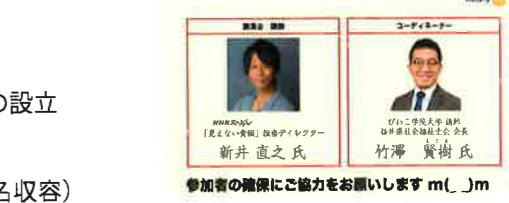
参加者の確保にご協力をお願いします m(_ _)m