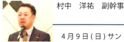
村中 洋祐 副幹事