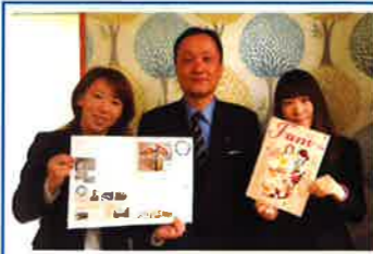
[平均年齢 42 歳に囲まれて]

現在、女性 3 人の小さな会社であります。今までも社員は全員元読者です。主婦目線・女性目線だからこそそのリアルな情報や、言葉ひとつの伝え方・商品ネーミングなど、女性が共感できる、響く発信のやり方をご提案させていただきます。