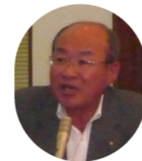
友好双子クラブ委員会

今年度も5回開催を予定しておりますので、皆様ふるってご参加ください。年会費は集めず、その都度の会費となりますので1、2回の方でも是非ご参加ください。