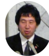
福井ローター アクトクラブ